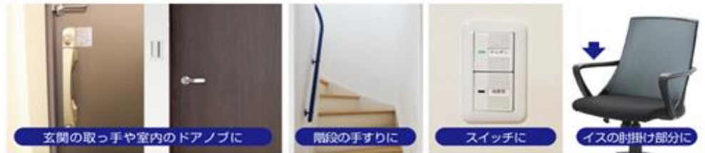
玄関の取っ手や室内のドアノブに